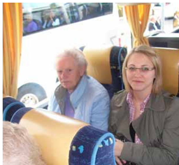
Seniorenachmittag der Stadt Damme