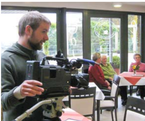
Gedreht wurde unter anderem auch in einem Gruppenraum und im Café Ausblick. Allen Mitwirkenden sei an dieser Stelle herzlichst gedankt!