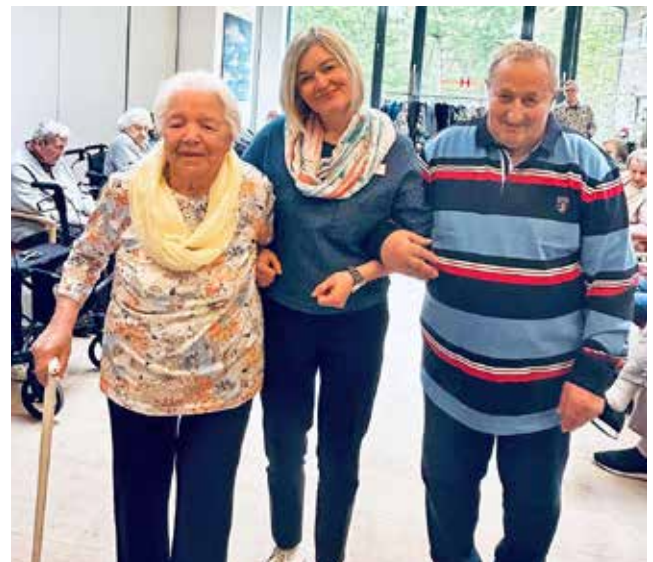
Zweimal im Jahr heißt es im Haus Maria-Rast: Bühne frei für unsere Modenschau.