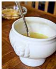
Als Tagessuppe gab es eine Nudelsuppe.

Fazit: Der Mittagstisch der Stiftung Maria-Rast in der Alten Hofburg ist ein bodenständiges, preislich sehr faires Angebot für alle, die in der Mittagspause drei kleine Gänge, ein sättigendes Menü und eine freundliche Atmosphäre schätzen.