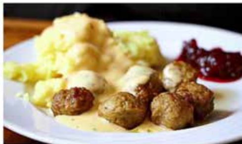
Die Köttbullar mit Kartoffelpüree, Rahmsauce und Preiselbeeren bilden eine kompakte, aber ausreichende Mahlzeit.