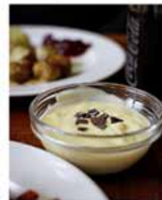
Fruchtquark rundet das kleine Menü ab.