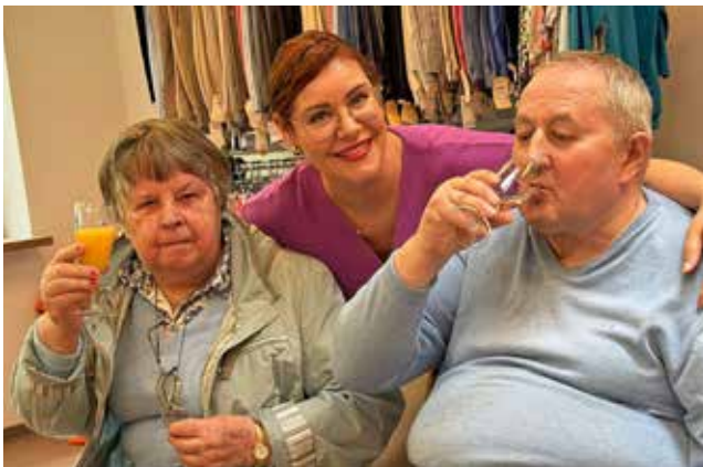
Gemeinsam mit dem ModeMobil aus Hagen sorgt der Begleitende Sozialdienst für Begeisterung bei den TeilnehmerInnen. Die Zuschauer sowie vor allem die Models haben immer mächtig Spaß an der Sache.