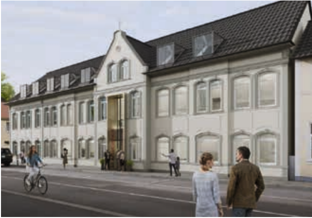
Dieser Entwurf vermittelt einen Eindruck von den Ideen für die geplanten Umbau- und Sanierungsarbeiten im St. Antoniushaus Vechta. Skizze: Ortmann&Möller

Das katholische Bildungs- und Exerzitienhaus St. Antonius in Vechta (Oldenburger Land) wird umfassend modernisiert. Das teilt das Bischöflich Münsterische Offizialat (BMO) in einer Pressemitteilung mit. Zuletzt wurde es laut Angaben Anfang der 2000er Jahre saniert, dabei sei ein Saal angebaut worden.