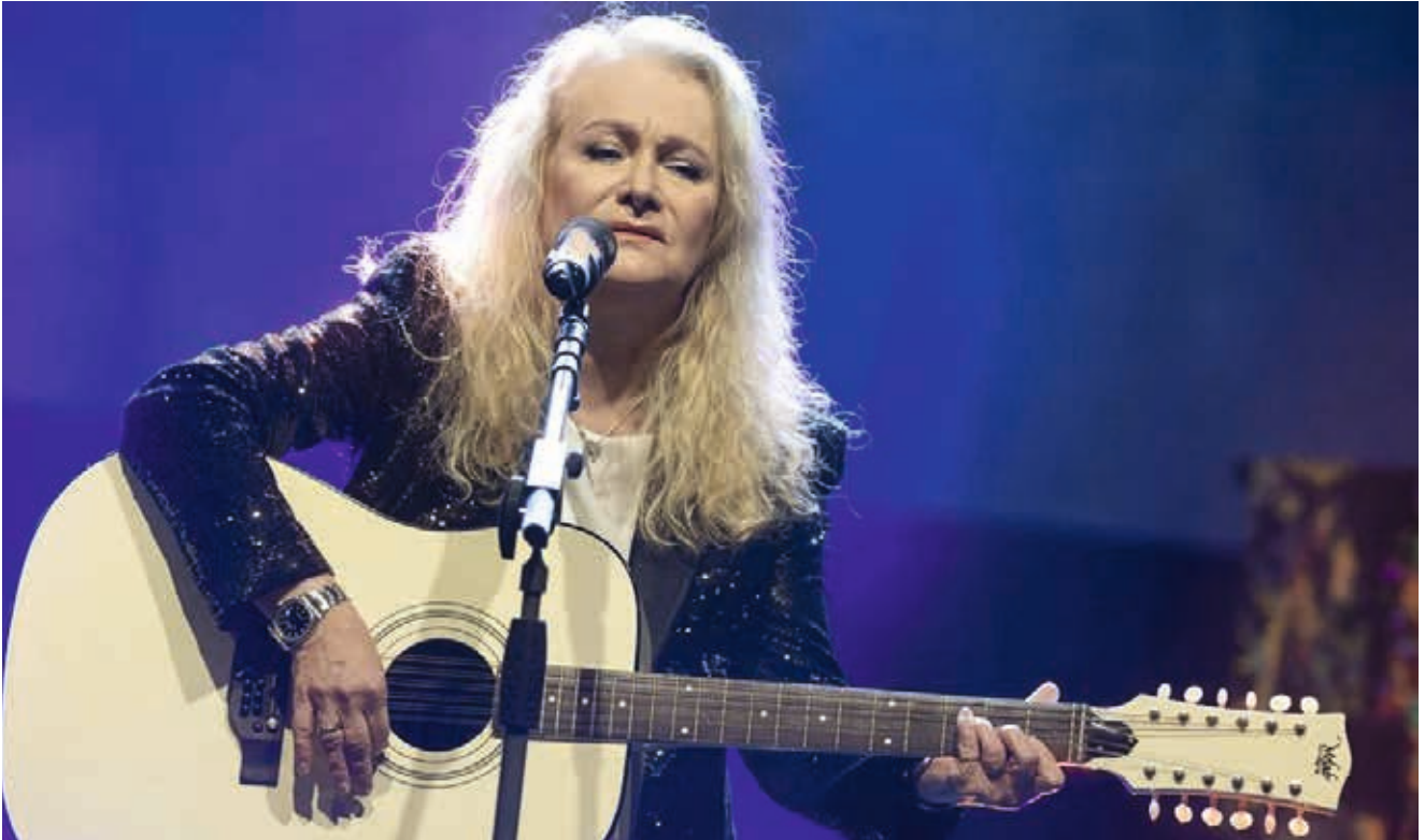
Nicole Seibert gewann 1982 den „Grand Prix d’Eurovison de la Chanson“ für Deutschland.

1982 gewann die Interpretin den „Grand Prix d’Eurovison de la Chanson“. Wie sie einmal dem verstorbenen Kirchenoberhaupt begegnete, erzählt sie hier.